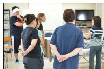
※移動・移乗の授業風景（初任者研修コース）